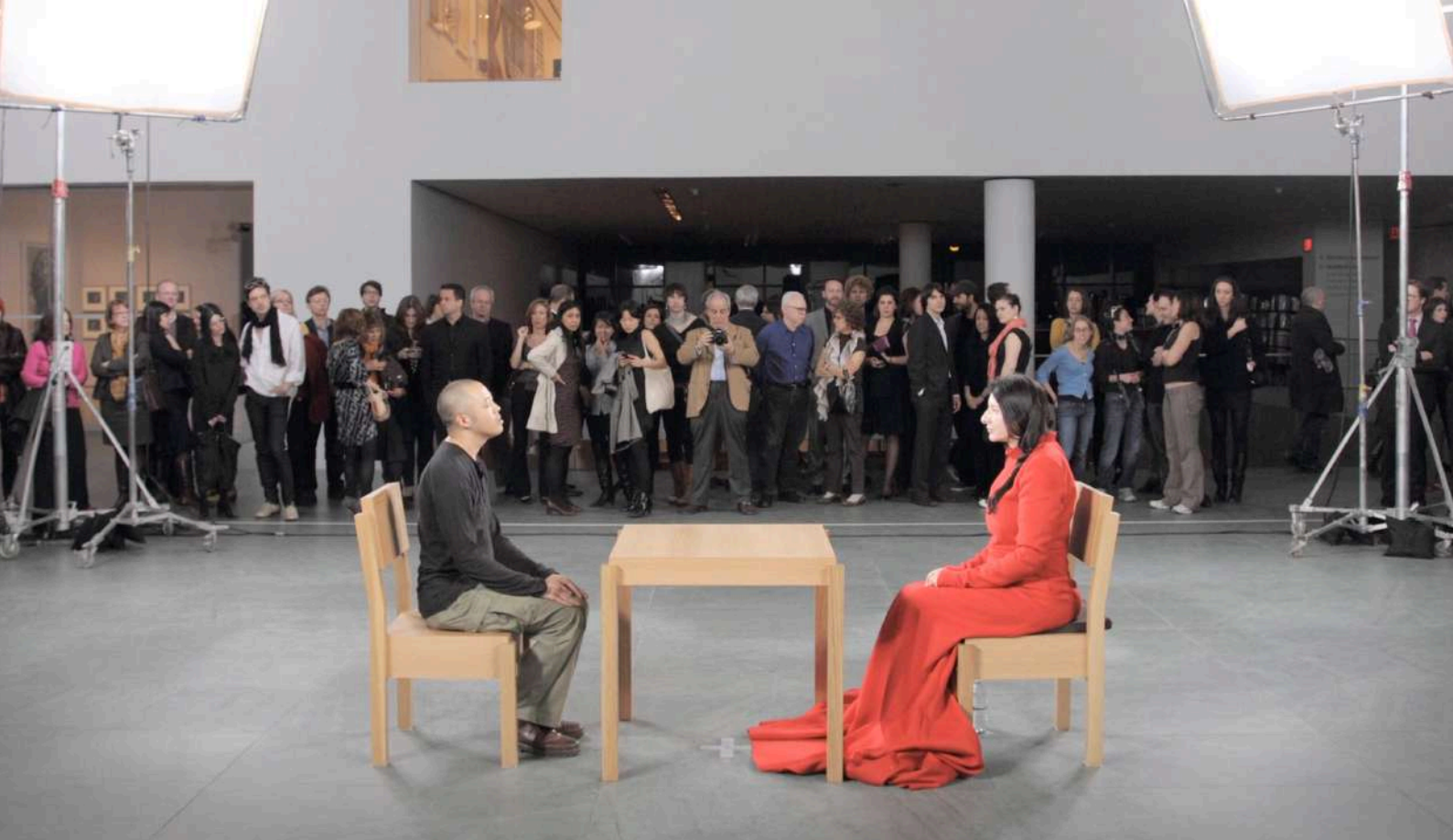
Marina Abramović*, The Artist Is Present , 2010, Museum of Modern Art (MoMA), New York.